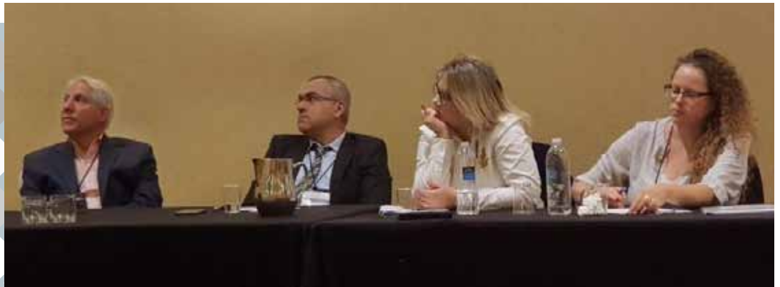
משטרת ישראל והמכון לקרימינולוגיה בכנס אכיפת החוק הגדול בעולם

יו"ר הפאנל היה פרופ' וויסבורד, חתן פרס ישראל לקרימינולוגיה. ראש המכון לקרימינולוגיה באוניברסיטה העברית, פרופ' חסייסי, והחוקרת והמרצה ד"ר יונתן-זמיר, הציגו את ממצאי מחקריהם האחרונים, אשר התנהלו בשנה האחרונה בשיתוף משטרת ישראל.