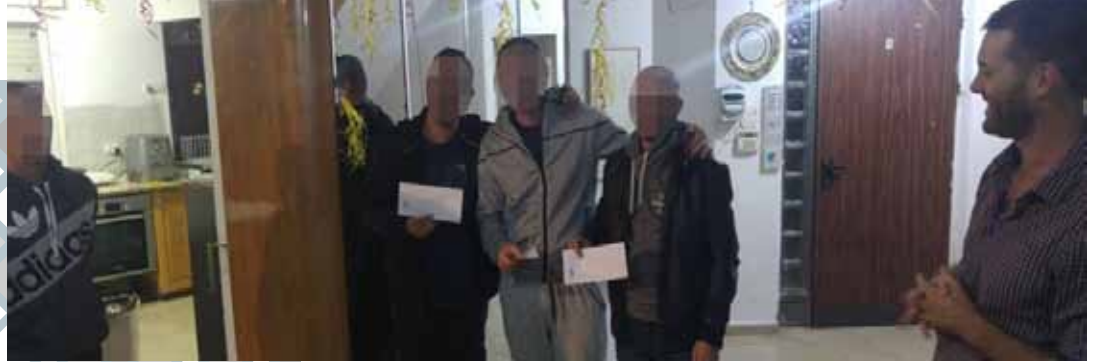
חלוקת מענקי הכשרה מקצועית לאסירים משוחררים המטופלים בהוסטל ירושלים.

← עידוד הכשרה מקצועית לאסירים משוחררים - אסירים המשתחררים מבתי הכלא מאופיינים בהיעדר רצף תעסוקתי, שינויים תדירים של מקומות עבודה, וחלקם אף נעדי כל ניסיון תעסוקתי בעברם. רבים מהם נפלטו ממערכת החינוך - פעמים רבות בשל הפרעות קשב וריכוז שאינן מאובחנות. לכל אלה השפעה ישירה על יכולתם להשתלב בתעסוקה יציבה ונורמטיבית לאחר שחרורם מהכלא. על כן פיתחה בשנה האחרונה רש"א מיזם לעידוד הכשרה תעסוקתית באמצעות מתן מענקי לימודים לאסירים משוחררים, מתוך הבנה כי הכשרה תעסוקתית תאפשר את השתלבותם המיטבית בעולם התעסוקה. עד כה חולקו מענקי התמדה בהכשרה מקצועית ל- 40 אסירים משוחררים.